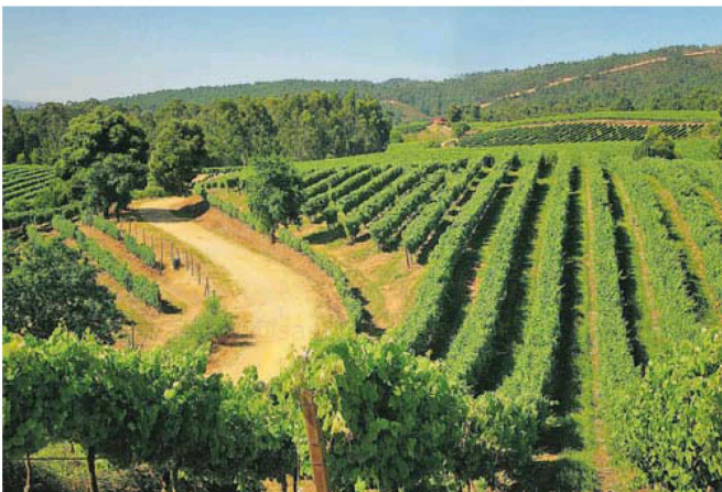
La iniciativa de investigación se realizará en viñedos gallegos y argentinos.