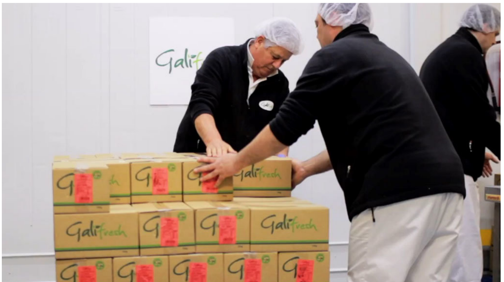
Trabajadores de Freshcut.

Freshcut es la empresa que Frutas Nieves fundó en 2012 con el objetivo de valorizar frutas, verduras y hortalizas desarrollando productos sin ningún tipo de conservantes, colorantes o azúcares añadidos, basados en la dieta equilibrada, y listos para su consumo bajo la marca Galifresh.