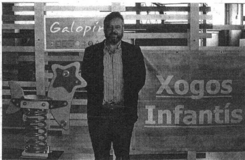
El creador y piloto de la sociedad, en una imagen tomada en la factoría

—Mi filosofía empresarial apuesta por la innovación, por ejemplo en nuestras gamas de juegos existe un caleidoscopio o el que quizá sea el balancín más grande del mundo, un juego participativo y singular en el que pueden divertirse hasta 50 niños. Existe un elemento al mismo tiempo característico y diferenciador en nuestras gamas