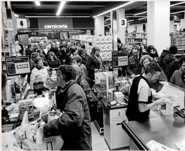
La enseña Gadis está en Galicia y Castilla y León.

Gadisa ganó su superficie comercial en 5.670 metros cuadrados ampliando tres supermercados Gadis y un hipermercado, abrió cuatro más de su propiedad bajo esa misma enseña y veinte nuevos franquiciados Claudio. Bajo esta cadena destaca el nuevo modelo Claudio Express, que se ha instalado en diferentes estaciones de servicio gallegas, como es el caso de las seis con las que desde el pasado mayo cuenta Galure-